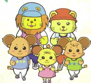
中央区キャラクター ウォーキングファミリー