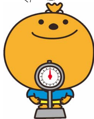
福岡市健康づくりイメージキャラクター よかろーもん