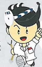
福岡市医師会 マスコットキャラクター 「おっしょくくん」