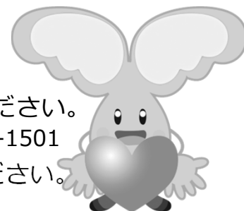
ぼくはジンキー! 福腎協キャラクター